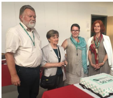
Predsedniki DBL