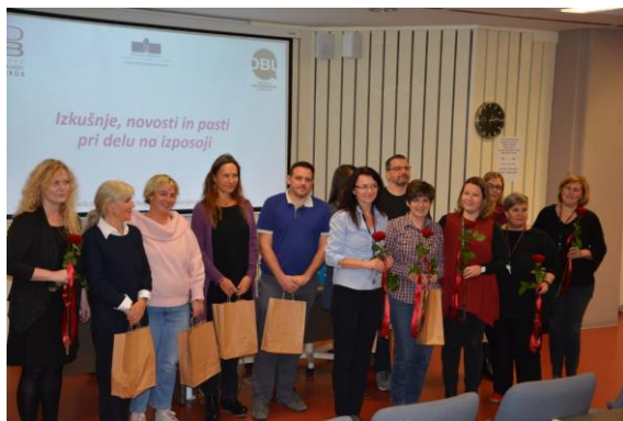
Predavatelji in organizatorji

V letu 2019 bi organizacijo razširili tudi na DBG in srečanje organizirali na Gorenjskem. Predlagan datum je sobota, 16. november 2019.