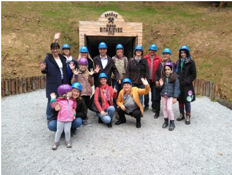
Skupinska izpred rudnika Sitarjevec