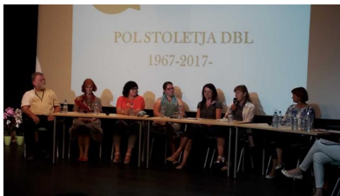
Okrogla miza